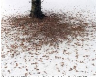
Margit Rabot, 2005, from series On der Geschichte, C print, 100x130cm