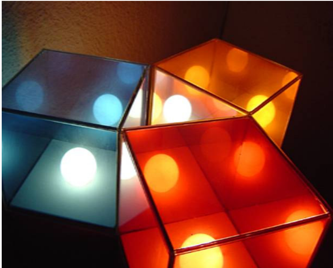
terque quaterque cmy, 2007 poliertes Eisen, Glas, Farbfilter, Glühbirne, 155 x 40 cm Durchmesser, 7 + 2