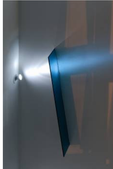
kunst am bau kaleidoscope, chieti (IT), 2006 LED, glas, Farbfolien