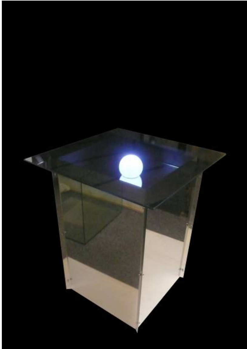
HOD, 2006 poliertes Eisen, Glas, Farbfilter, Glühbirne, 60 x 48 x 48 cm Durchmesser, 7 + 2